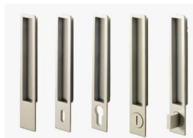
Zapuštěná mušle MAYA