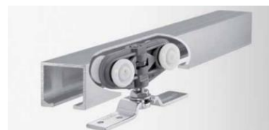
Posuvný mechanismus GEZE Rollan 40 / Rollan 80