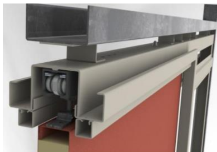
STZ – PIL ve zdi jdoucí